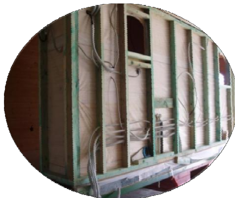
Passage des gaines électriques et tuyaux d'eaux dans la structure