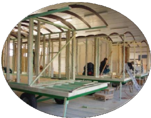
Montage de l'ossature sur le châssis