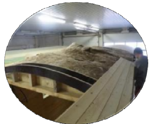
Isolation complète de roulotte Plafond, plancher et parois